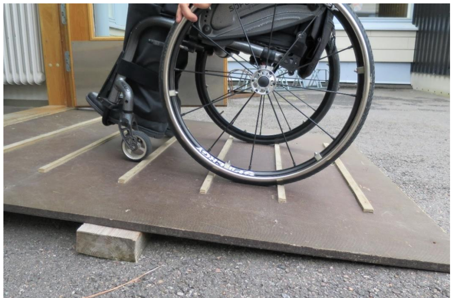
Kuva 2. Vaikeakulkuinen luiska

Takaovelle johtavan sisäänkäynnin luiska oli vaikeakulkuinen pyörätuolia käyttävälle henkilölle, koska vanerilevystä tehtyyn luiskaan oli kiinnitetty liikkumista hankaloittavat poikittaispuut (korkeus noin 2 cm). Vaskipellon äänestysalueen vaalilautakunnan puheenjohtaja lupasi ryhtyä toimenpiteisiin epäkohdan korjaamiseksi ja sanoi välittävänsä tiedon koulun talonmiehelle (tms. huollosta vastaavalle taholle), jotta luiska saadaan korjattua esteettömäksi.