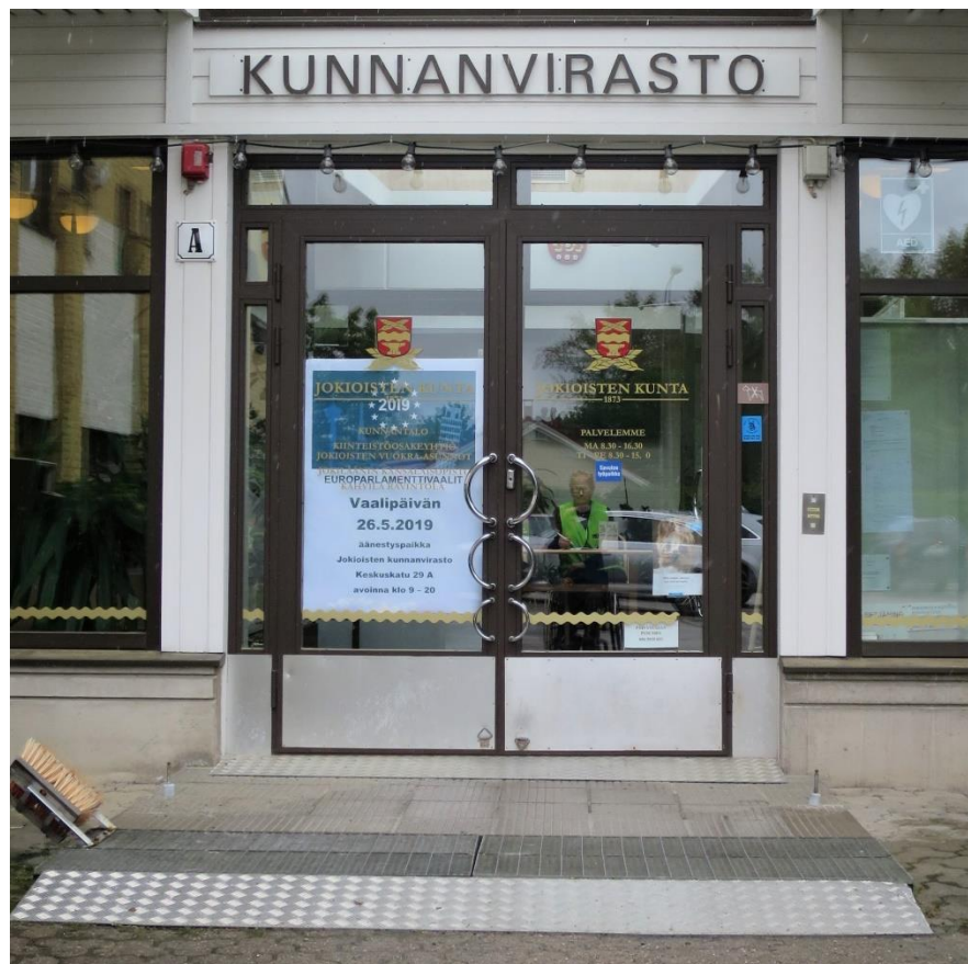
Kuva 13. Esteetön sisäänkäynti äänestyspaikalle

Kunnanviraston valtuustosalin ainoa vaalipäivän äänestyspaikka Jokioisten kunnassa. Äänestyspaikalle oli asianmukaiset opasteet. Kunnanviraston pihalla pääsisäänkäynnin läheisyydessä oli kaksi merkittyä invapysäköintipaikkaa. Piha-alue oli kova ja tasainen. Sisäänkäynti oli esteetön ja ovi oli miellyttävän kevyt avata pyörätuolista käsin.