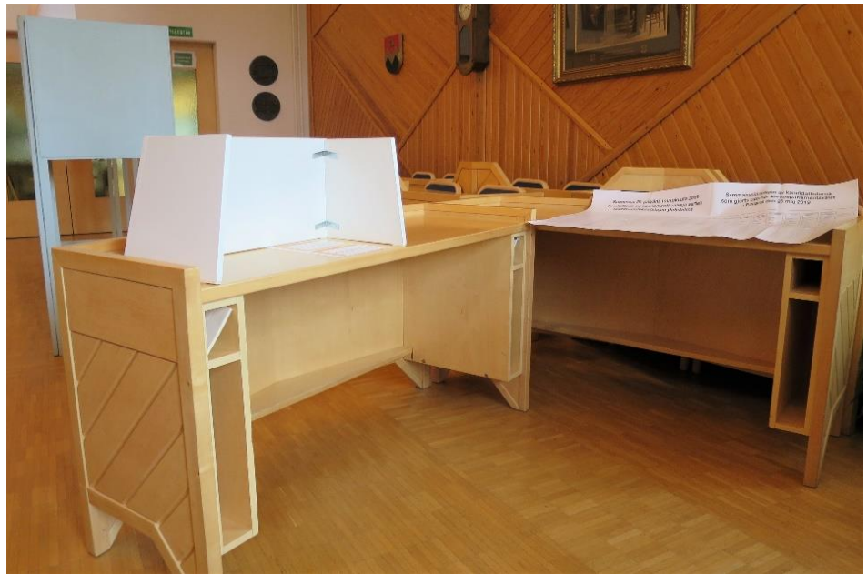
Kuva 14. Näkösuojalla varustettu äänestyspaikka

Äänestyspaikalla oli liikkumisesteisille henkilöille järjestetty esteetön äänestuspöytä. Pöytä oli riittävän leveä ja sen jalkatilan korkeus oli 73 cm. Pöydän kirjoitustason päälle oli rakennettu näkösuoja, joka tarkastajien havaintojen mukaan riitti turvamaan vaalisalaisuuden. Valaistus oli riittävä. Tilassa oli induktiosilmukka, joka ei vaalilautakunnan puheenjohtajan näkemyksen mukaan kuitenkaan ollut päällä, koska valtuustosalin äänentoistojärjestelmä ei ollut kytkettynä päälle.