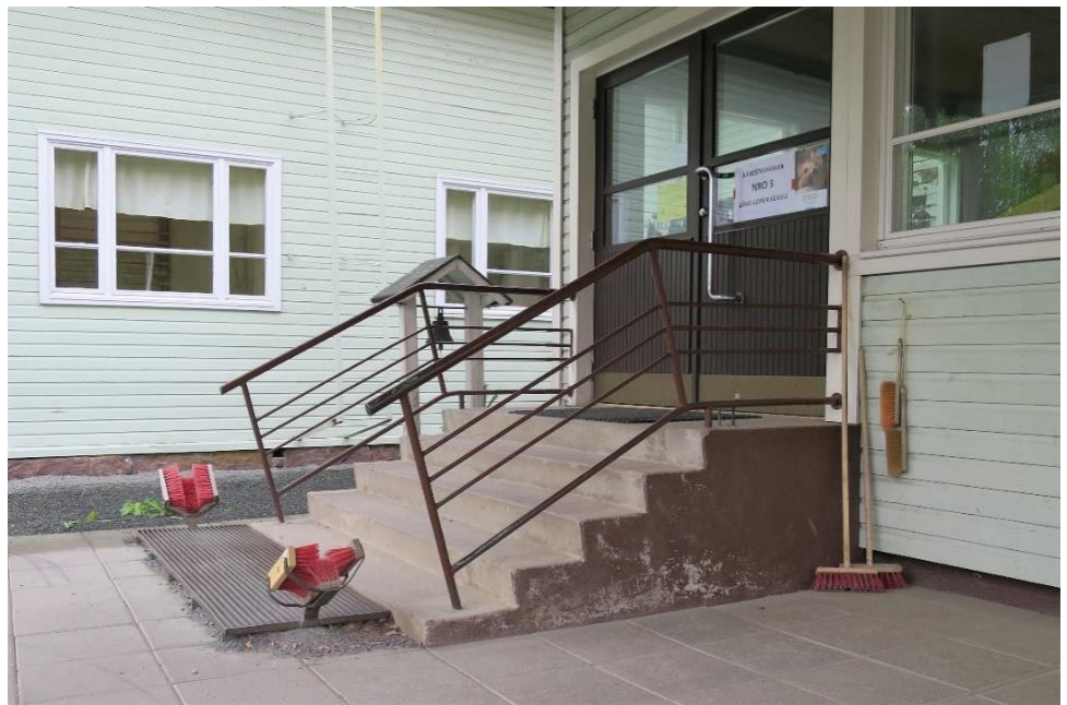
Kuva 6. Äänestyspaikan ulko-ovelle johtava portaikko

Topenon äänestysalueen äänestyspaikkana oli Länsi-Lopen koulu, joka sijaitsi vanhassa puurakennuksessa. Opaste äänestyspaikalle oli vasta koulun pääovella. Pihalla ei ollut merkittyä invapysäköintipaikkaa. Piha-alue oli pääasiassa soraa, mutta sisäänkäynnin edessä oli laatoitettu alue. Äänestyspaikan sisäänkäynti ei ollut esteetön portaikon vuoksi. Pyörätuolilla ei päässyt sisälle omatoimisesti, eikä turvallisesti avustettunakaan.