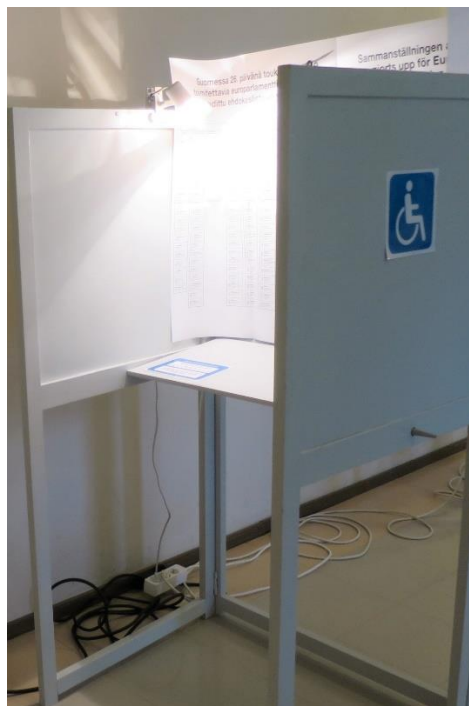
Kuva 11. Lisävalaisin kopissa

Tarkastajien havaintojen mukaan äänestyskoppien sijoittelu ei ollut täysin onnistunut. Äänestyskopit olivat rivissä siten, että vessasta äänestäjän selän takaa tuleva henkilö saattoi nähdä äänestyskoppiin. Lisäksi inva-wc:n ovi oli aivan liikuntaesteisille henkilöille tarkoitetun äänestyskopin takana.