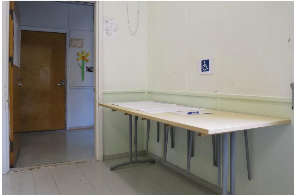
Kuva 7. Liikuntaesteisille henkilöille tarkoitettu äänestyspaikka

Äänestyspaikalla oli yksi nimetty vaaliavustaja. Saadun tiedon mukaan oman avustajan käytöstä tehdään merkintä vaalipöytäkirjaan. Avustamistehtävien määrä oli ollut noin 1-2 vaaleittain. Äänestyspaikalla ei ollut saatavilla suurennuslasia tai muuta vastaavaa apuvälinettä heikonäköisiä äänestäjiä varten. Äänestyspaikan valaistus oli riittävä ja äänestyspaikalla oli tuoleja levähtämistä varten. Vaalilautakunnan puheenjohtajan mukaan äänestäjät eivät olleet antaneet erityistä palautetta äänestysjärjestelyistä.