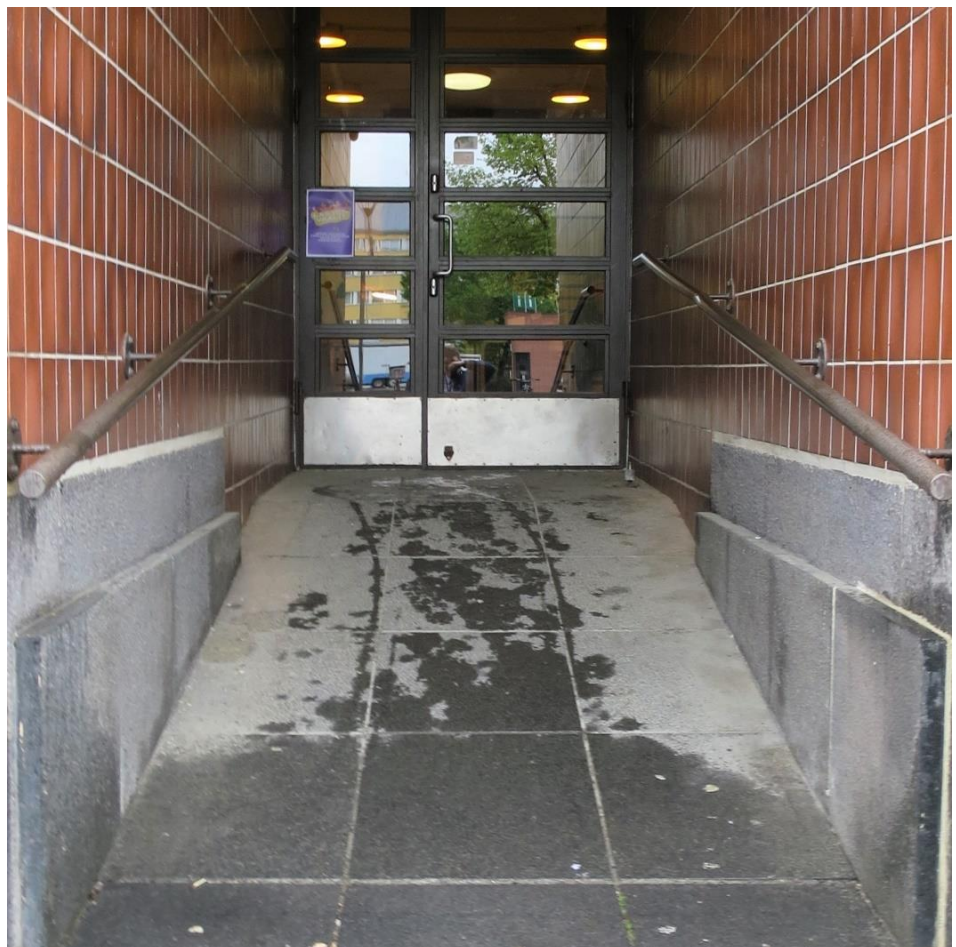
Kuva 10. Sisäänkäynnille johtava luiska

Äänestyspaikkana oli Forssan teatteritalo. Pääsisäänkäynnille johti jyrkkä luiska, joka oli kaltevuudeltaan noin 10 astetta (n. 17,5 prosenttia). Luiskan jyrkkyyden vuoksi omatoiminen kulkeminen pyörätuolilla saattoi olla hankalaa. Kuten edellä on todettu, rakennuksen esteettömyydestä annetun valtioneuvoston asetuksen, joka koskee luvanvaraista uudis- ja korjausrakentamista, 2 §:n 2 momentin mukaan luiskan kaltevuus saa olla enintään viisi prosenttia ja tietyssä asetuksessa määritellyssä tilanteessa enintään 8 prosenttia. Ulkotilassa luiska saa kuitenkin olla kaltevuudeltaan yli viisi prosenttia vain, jos se voidaan pitää sisätilassa olevaan luiskaan verrattavassa kunnossa.