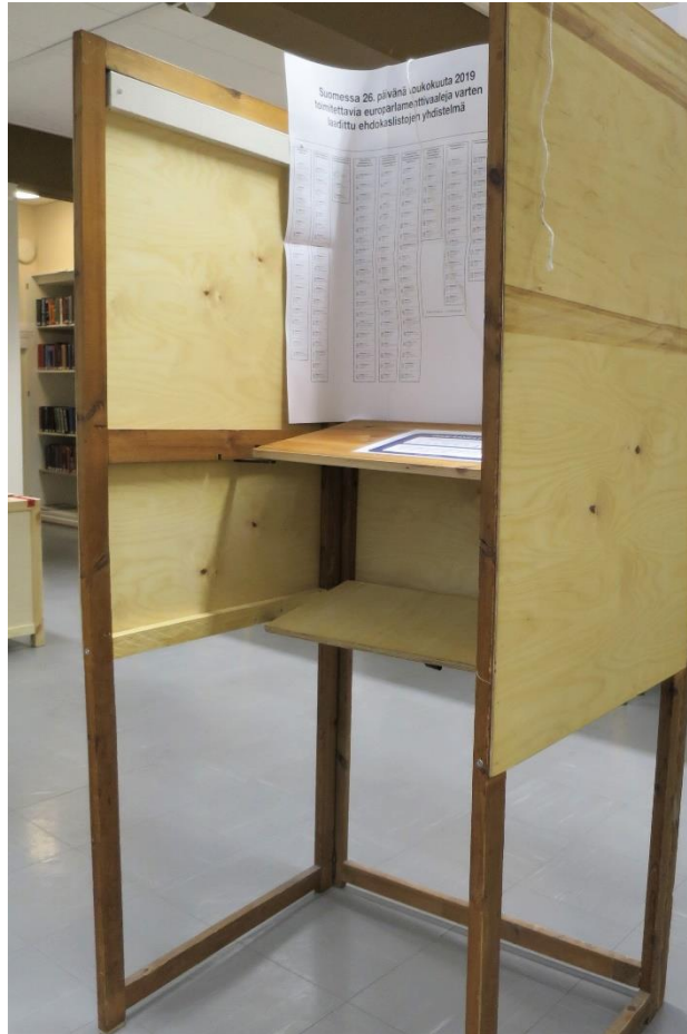
Kuva 16. Äänestyskoppi liikuntaesteisille

Äänestyspaikalla oli saatavilla suurennuslasi heikkonäköisiä äänestäjiä varten. Äänestyspaikalla oli istuimia levähtämistä varten tarkoitettu tuoli. Äänestyspaikka oli ilmapiiriltään rauhallinen, vaikka äänestystila oli melko ahdas. Äänestyspaikalla ei ollut inva-wc:tä. Vaalilautakunnan puheenjohtajan mukaan äänestäjät olivat pitäneet myönteisenä sitä, että Suomusjärvellä on oma äänestyspaikka vaalipäivänä, eikä äänestäjien tarvitse lähteä omalta kylältä pidemmälle äänestämään.