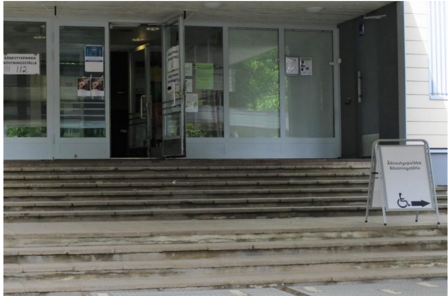
Kuva 1. Pääsisäänkäynti ja opastus vaihtoehdoiselle sisäänkäynnille

Noin 150 metrin kulkureitti liikuntaesteisille henkilöille tarkoitetulle sisäänkäynnille kulki jyrkän mäen (n. 20 m) kautta. Mäen jyrkkyyden vuoksi omatoiminen kulkeminen pyörätuolilla saattoi olla hankalaa. Takapihalla oli merkitty invapysäköintipaikka, josta oli noin 20 metrin matka takaovelle.