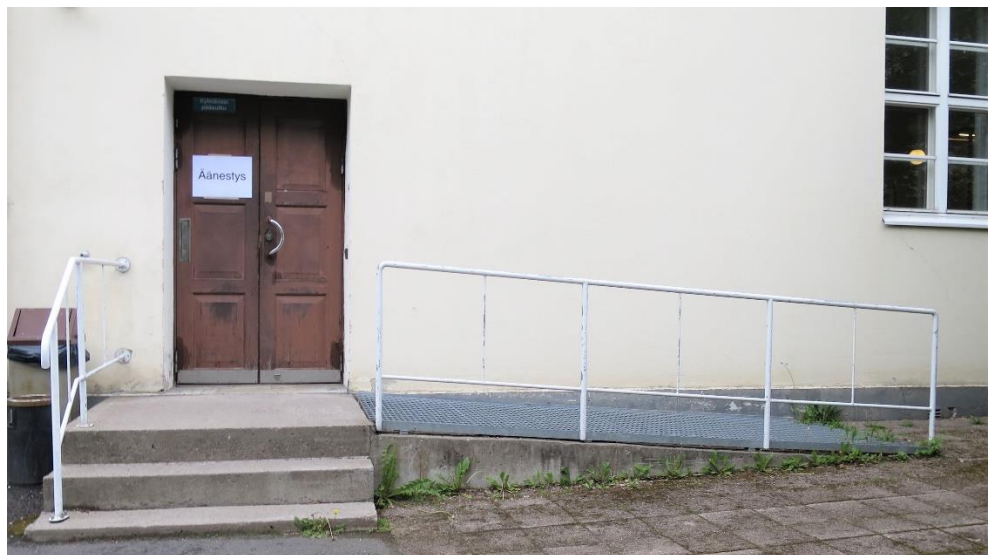
Kuva 4. Luiska sisäänkäynnille

Kansalaisopiston takaovesta ei mahtunut sisään manuaalipyörätuolilla, koska ovi oli liian kapea (58 cm). Sisätilaan pääsemiseksi piti avata myös viereinen ovi, jota ei saanut avattua omatoimisesti pyörätuolista käsin. Vaalilautakunnan puheenjohtaja kertoi tarkastajille, että takaoven viereisellä seinustalla oli ovikello, jota soittamalla vaaliavustaja olisi tullut avaamaan oven. Tästä ei kuitenkaan ollut mitään opastusta. Tarkastajat eivät myöskään havainneet ovikelloa ensimmäistä kertaa paikalle saapuessaan.