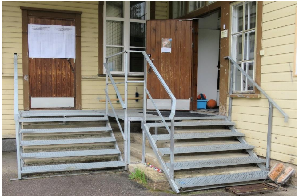
Kuva 8. Äänestyspaikan ulko-ovelle johtava portaikko

Äänestyspaikalle oli järjestetty liikkumisesteisille henkilöille erillinen äänestystila koulun keittiöön. Pöytänä ja kirjoitusaluslana oli metallinen pyörillä varustettu tarjoiluvaunu, jonka päälle oli levitetty ehdokaslista. Pöydän ääreen ei päässyt pyörätuolilla, koska tarjoiluvaunu ei ollut alhaalta avonainen. Esteettömyyden kannalta ongelmallista oli myös se, että tarjoiluvaunu oli sijoitettu aivan roskakorin ja lavuaarin vieressä.