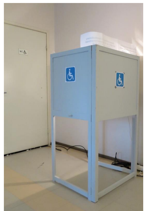
Kuva 12. Inva-wc kopin takana