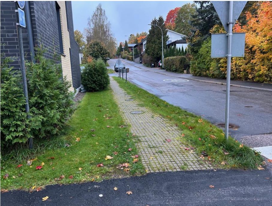
Kuvia havaituista puutteista