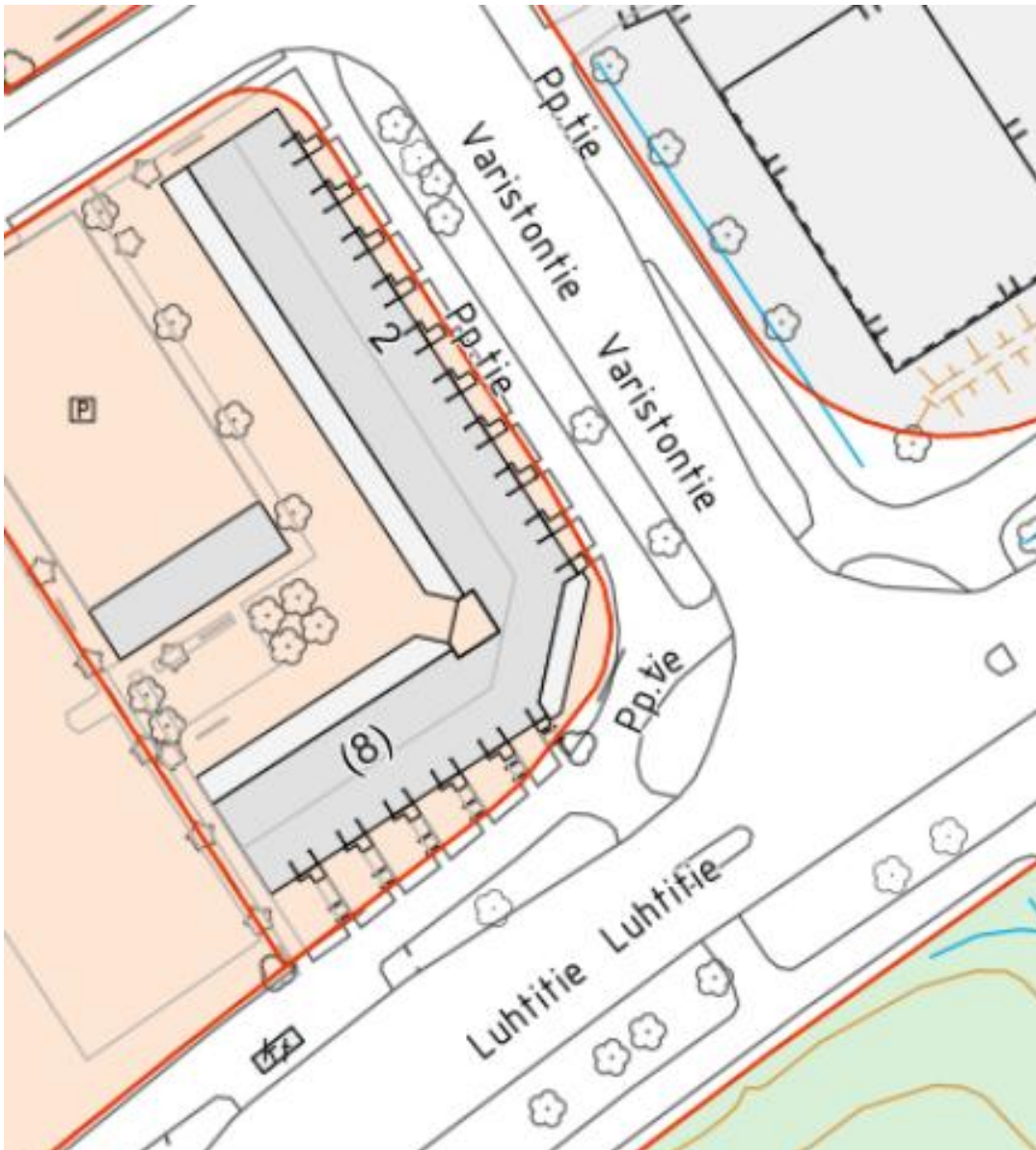
Kartta alueesta, jolla luvaton käyttöä havaittu